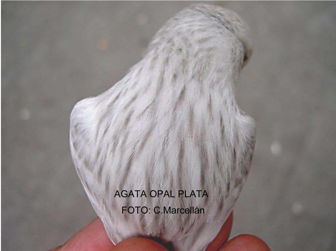
Foto 6 Ágata opal Plata